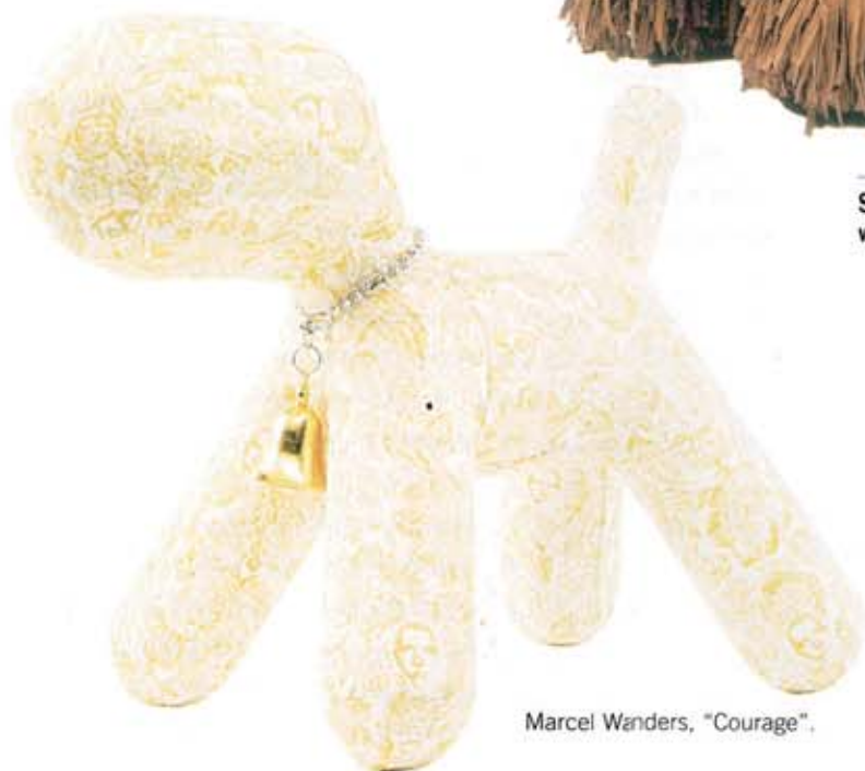
Marcel Wanders, "Courage".