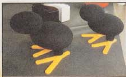
TIP: Den tugeleignende kosetolen «Tipi» koster 16 600 kroner.