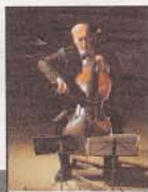
ALENE: Truls Mørks overbevisning med Bachs og Brittens suiteer for solo cello i Bergen i går.