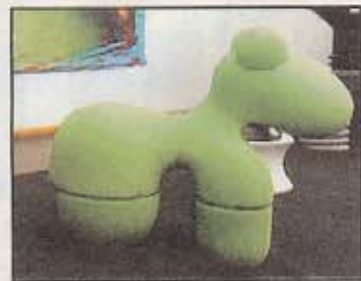
PONNY: Pony-stolene koster 22 750 kroner.