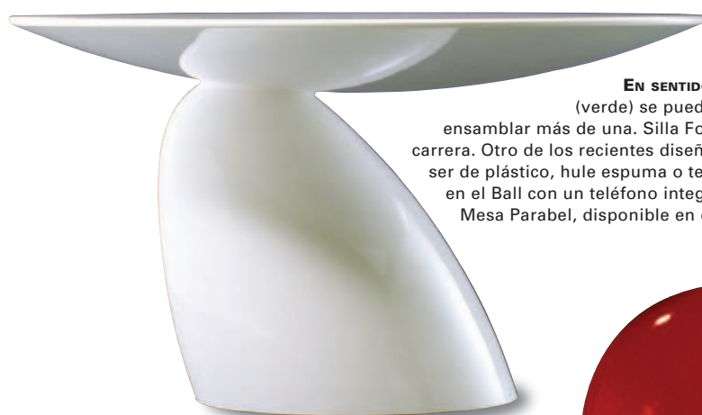
EN SENTIDO HORARIO: La mesa Copacabana (verde) se puede colocar individualmente o ensamblar más de una. Silla Formula, inspirada en los autos de carrera. Otro de los recientes diseños de Aarnio, la silla Focus puede ser de plástico, hule espuma o tela. Tomato Chair. El finlandés sentado en el Ball con un teléfono integrado. La silla Pastil de 1968. Mesa Parabel, disponible en diferentes tamaños.